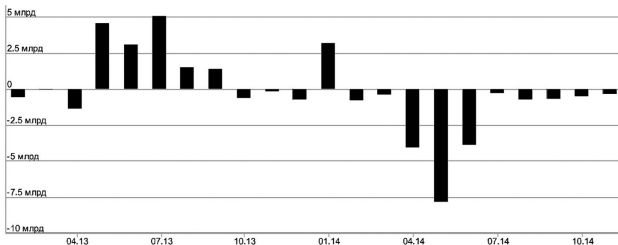
Рис. 1. Приток/отток средств населения в ПИФы

без учета данных по закрытым фондам и фондам для квалифицированных инвесторов.