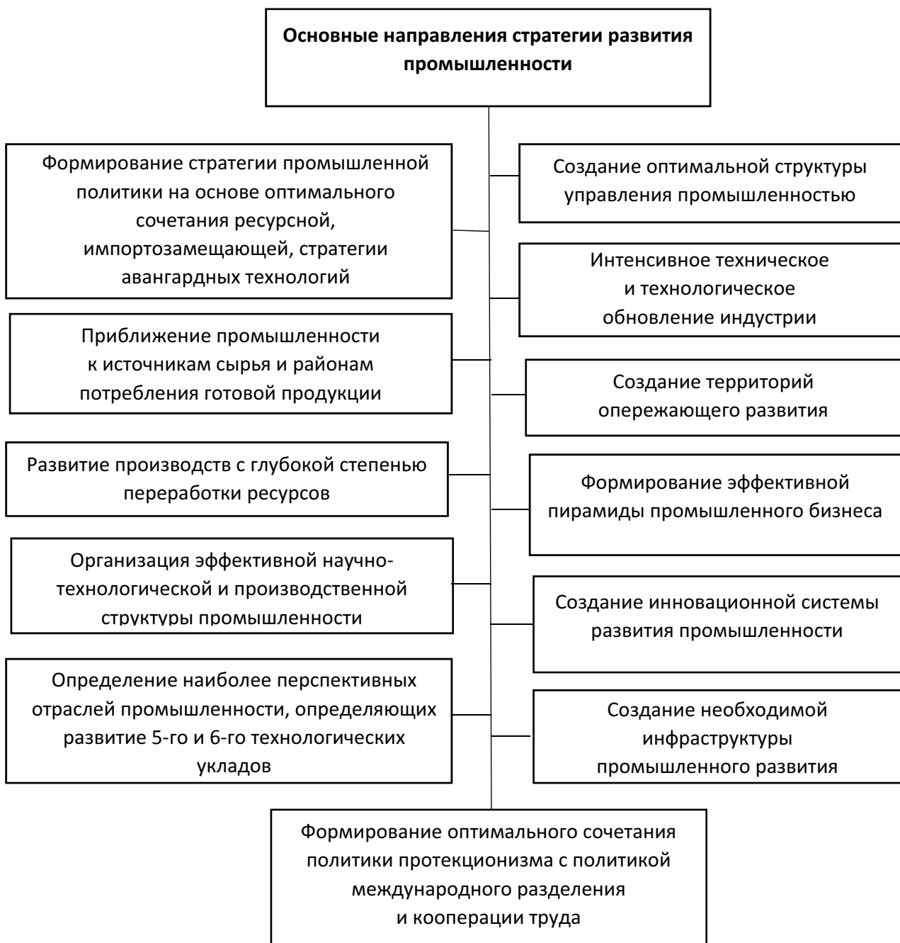
Рис. 3. Основные направления стратегии развития промышленности России

политику, производить высокоэффективное оборудование и высококачественную продукцию для отечественного и мирового рынков. Однако в России в каждой отрасли промышленности мы не имеем подобной сложившейся высокоэффективной структуры объединений, определяющей промышленную политику в отрасли. В этих условиях прямолинейное использование функциональной структуры управления не позволит обеспечить эффективную промышленную политику без