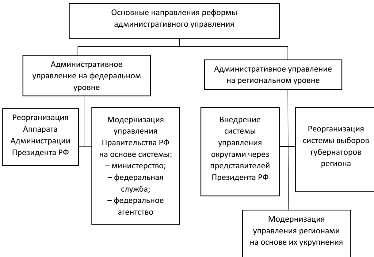
Рис. 1. Направления реформы государственного и регионального управления

В качестве основных задач реализованной ныне административной реформы были выделены: