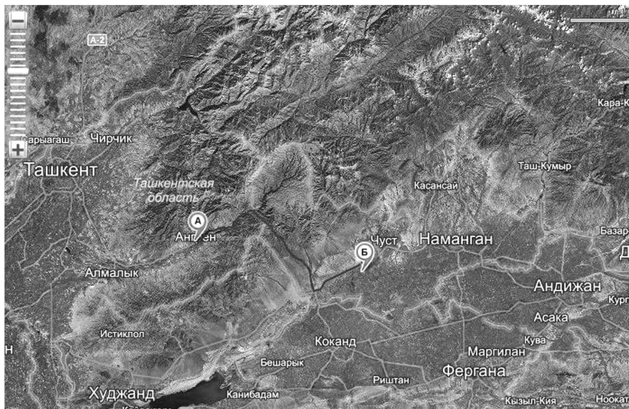
Рис. 1. Железнодорожная линия Ангрэн — Пап