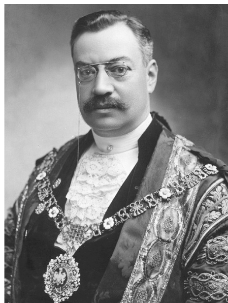
Рис. 5. Сэмюэль Маркус

Сефардская семья Сэмюэлей переселилась в XIX в. из Багдада в Лондон. Члены семьи занимались торговлей, в основном, с Восточной Азией (компания « M. Samuel & Co. »). Маркус Сэмюэль (1853–1927) (рис. 5) в 1897 г. основал « Shell Transport and Trading Company », в 1907 г. ставшую частью « Royal Dutch Shell ». Маркус Сэмюэль получил аристократический титул «1-й виконт Берстед». Далее компания « M. Samuel & Co. » была преобразована в банк « Hill Samuel », позже ставший частью « Lloyds TSB ». Семья Сэмюэль сыграла большую роль в поддержке японской индустриализации, создании первых в мире танкеров. Члены семьи также занимались политической деятельностью (Маркус Сэмюэль был лорд-мэром Лондона), в XX в. занимали руководящие посты в компании « Royal Dutch Shell » и « Lloyds Bank ». Наиболее известные финансисты, представители семьи — Сэмюэль (1855–1934), Вальгер (1882–1948), Маркус (1909–1986), Питер (1911–1996) [7].