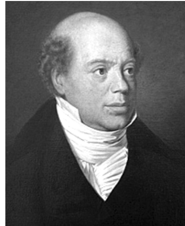
Рис. 4. Ротшильд Натан Майер

На рубеже XVIII–XIX вв. лидирующую роль в финансах Англии начинают играть Ротшильды. Основатель британской династии Ротшильдов — Натан Майер Ротшильд (1777–1836) (рис. 4), третий сын Майера Амшеля Ротшильда, обосновался в Манчестере в 1798 г., а в 1809 г. переехал в лондонский Сити и в 1811 г. основал « N.M. Rothschild & Sons ».