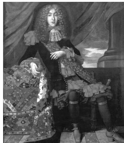
Рис. 1. Суассо Франсиско Лопес

Роль еврейских капиталов в Англии значительно возрастает с основанием в 1694 г. Английского банка. Несмотря на то, что в фундаментальной истории Английского банка роль евреев-марранов вообще не рассматривается [8], известный историк и экономист В. Зомбарт считал, что именно они сыграли важную роль в создании этого первого в мире центрального банка, ставшего в XVIII в. крупнейшим мировым финансовым центром [9]. Для этого мнения есть серьезные основания. Семьи Суассо и Перейро занимались финансовой деятельностью в Амстердаме и других городах Европы в XVII в., были тесно связаны с голландской Ост-Индской компанией, значительная часть акционерного капитала которой принадлежала евреям-марранам. Именно они приняли наиболее активное участие в создании Английского банка в 1694 г. Франсиско Лопес Суассо (рис. 1) из Амстердама стал одним из главных спонсоров (наряду с Якобом Перейрой) для снаряжения военной экспедиции в Англию принца Оранского, которая привела к «славной революции», воцарению на английском престоле принца Оранского и созданию в Лондоне Английского банка. Франсиско Лопес Суассо предоставил в 1688 г. огромную ссуду (два миллиона гульденов) Вильгельму Оранскому для захвата английского престола, отвечая при этом и за переброску войск в Англию. Вильгельм Оранский, захватив английский трон, стал королем Вильгельмом III и создал Английский банк, ставший в XVIII в. важнейшим мировым финансовым