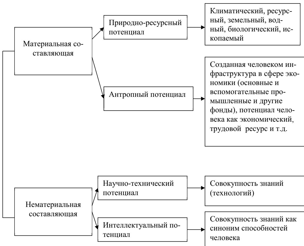
Рис. 3. Структура экономического потенциала региона при разработке региональной инновационной антикризисной программы

Особенностью современных региональных антикризисных программ является недостаточный уровень использования собственного экономического потенциала и порой бездумное дублирование федеральных антикризисных мероприятий [3]. Вместе с тем в настоящее время для выхода региональной экономики на магистральный путь развития необходимо стимулирование к внедрению инноваций в субъектах Российской Федерации, поскольку именно они должны стать катализатором преодоления кризисного состояния, источником для создания региональной конкурентоспособной продукции как на внутреннем, так и на внешних рынках, т.е. позволят интегрировать региональную экономику в мировую конкурентную среду. Исходя из этого, стратегию разработки региональной антикризисной программы можно представить, как показано на рис. 4.