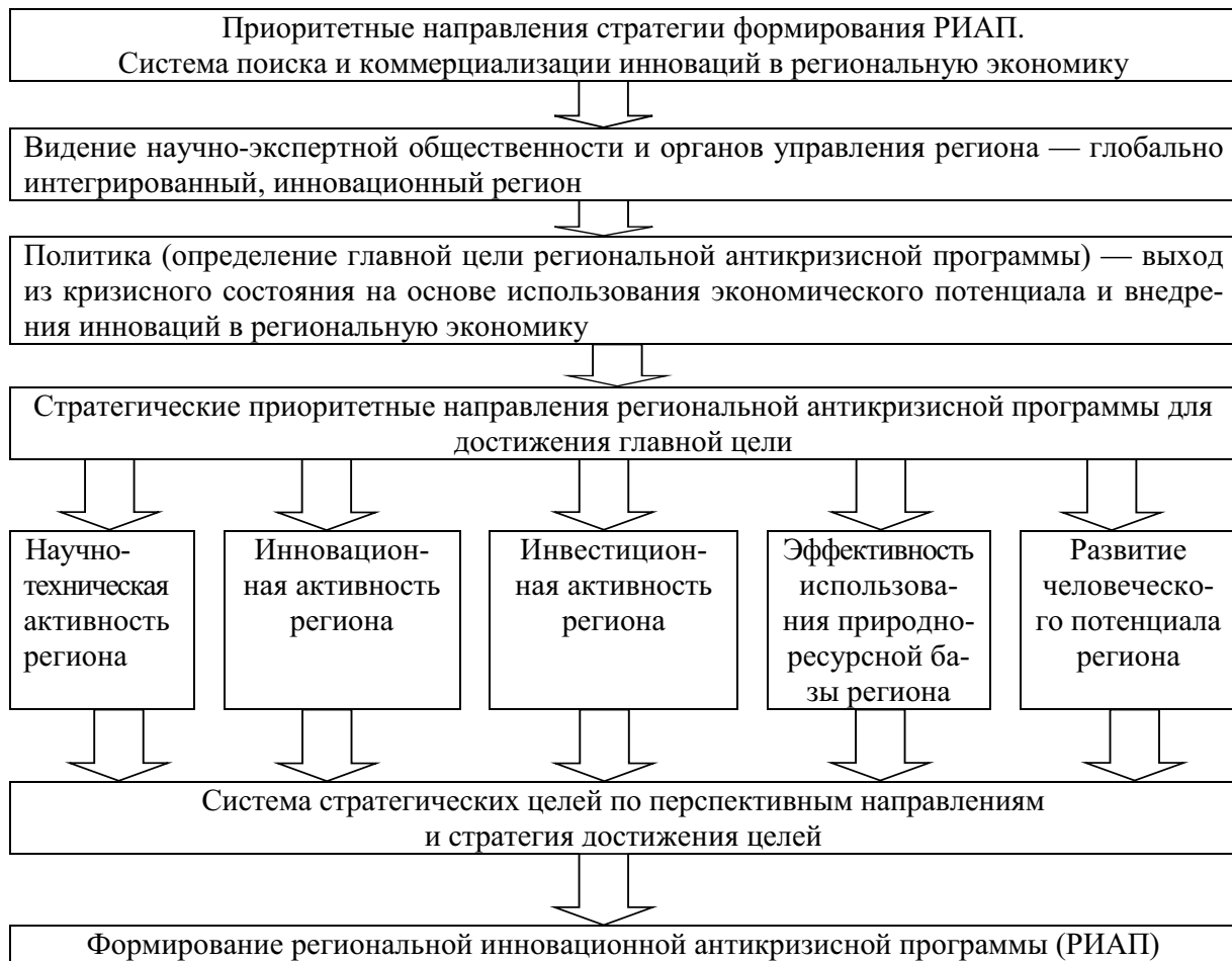
Рис. 4. Стратегия разработки региональной антикризисной программы на основе внедрения инноваций в региональную экономику

Кроме внешних условий, к причинам возникновения кризисных факторов в региональном развитии следует также отнести и управленческие решения, принимаемые высшим эшелоном власти субъекта РФ. Неэффективность регионального управления в настоящее время зачастую обусловлена как превалированием личных интересов чиновников, так и отсутствием стратегического мышления, которое в первую очередь должно быть направлено на локализацию «точек роста», приводящих к мультипликативному эффекту в региональной экономике, стимулированию инновационной активности субъектов предпринимательской деятельности, сохранению и эффективному использованию природно-сырьевого и промышленного комплексов.