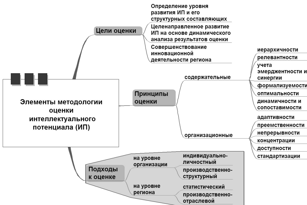
Рис. 2. Элементы методологии оценки интеллектуального потенциала региона