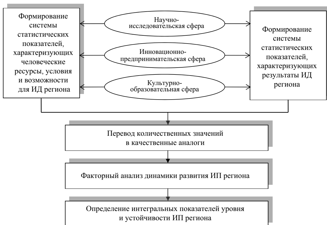
Рис. 3. Модель статистической оценки интеллектуального потенциала региона (ИД – инновационная деятельность)