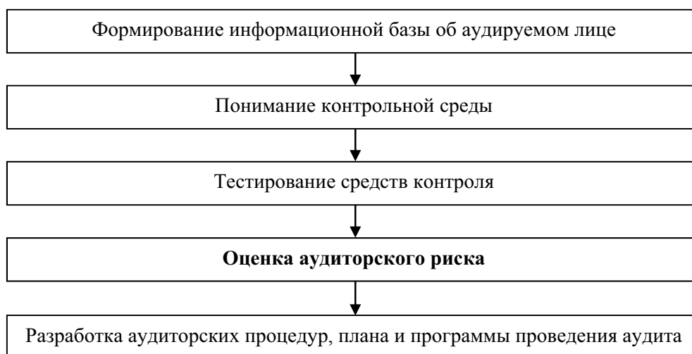
Рис. 1. Место оценки аудиторского риска при планировании аудиторской проверки

Процесс оценки аудиторского риска на всех ее этапах сопровождается профессиональными суждениями аудитора. Например, в Федеральном стандарте аудиторской деятельности (ФСАД) 1/2010 «Аудиторское заключение о бухгалтерской (финансовой) отчетности и формирование мнения о ее достоверности» можно ознакомиться с размещенными примерами аудиторских заключений, в которых имеется раздел «Ответственность аудитора», где аудитор указывает, что выбор необходимых аудиторских процедур осуществляется исходя из его профессионального суждения, в основе которого лежит