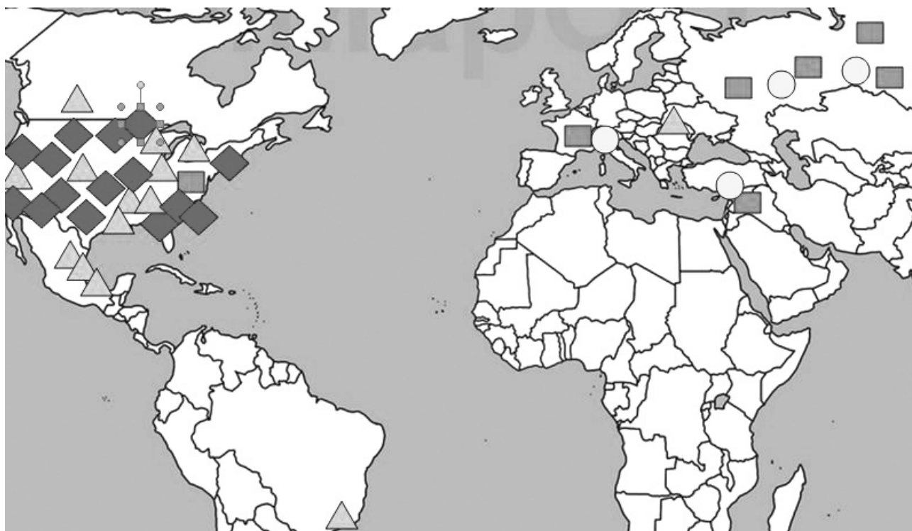
Рис. 2. Фрагмент схемы пространственного расположения активов металлургических корпораций

Географическое расположение активов российских и североамериканских корпораций ставит последние в более преимущественное положение с точки зрения емкости рынков, возможностей применения инновационных технологий и использования высококвалифицированных трудовых ресурсов, повышения интенсивности функционирования