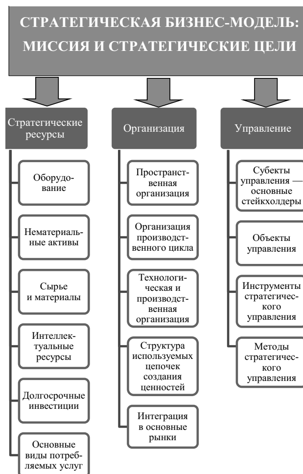
Рис. 1. Структура стратегической бизнес-модели корпорации или группы предприятий

Как видно из табл. 1, в 30 крупнейших мировых производителей стали в 2014 г. во-