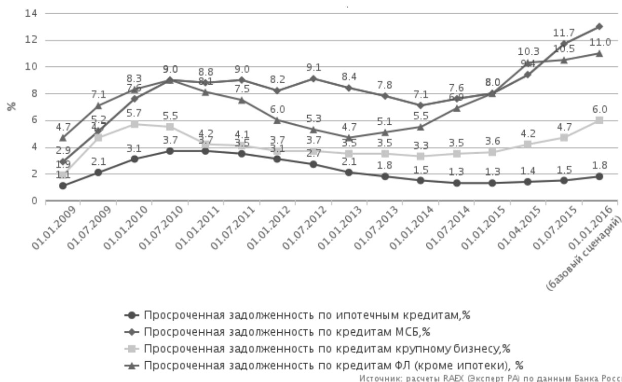
Рис. 3. Просроченная задолженность на балансе банков

адекватно оценивать кредитный риск заемщиков из числа малых и средних предприятий из-за отсутствия прозрачной отчетности и низкого уровня централизованного отслеживания кредитных историй организаций-заемщиков или обмена информации между