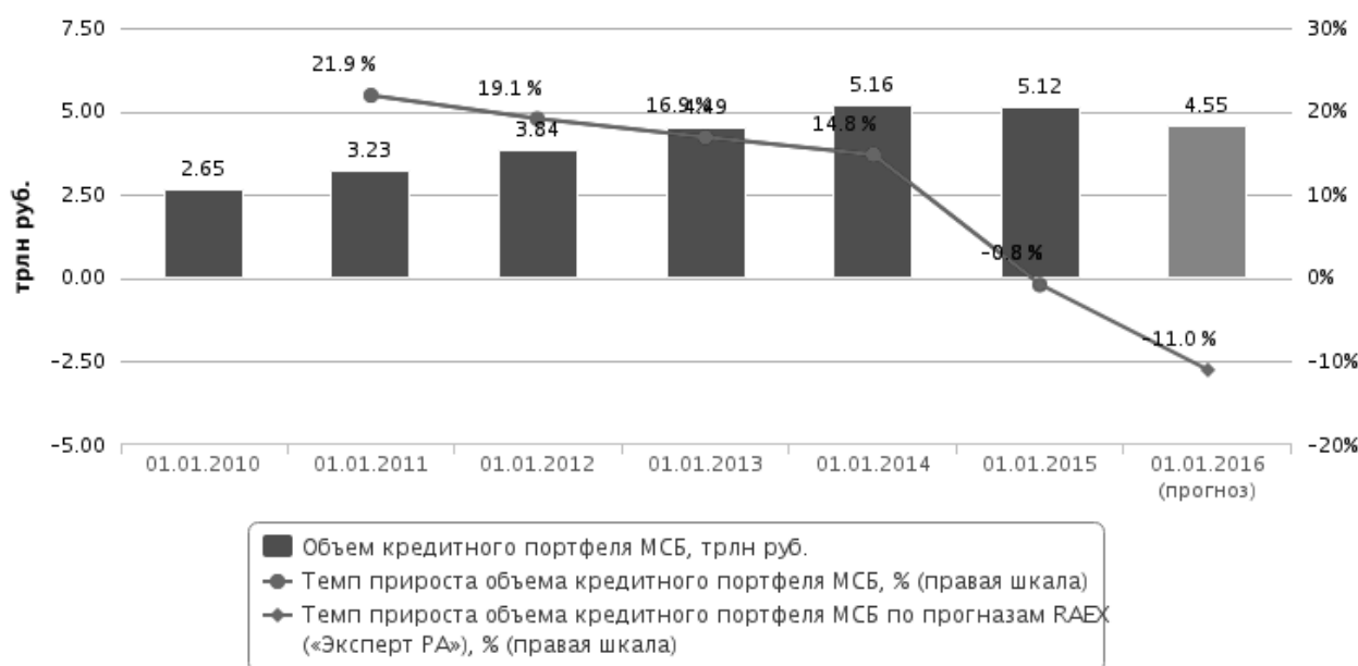
Рис. 4. Изменение портфеля кредитов МСП

При предоставлении кредитов банкам приходится учитывать, что не все операции и не всю выручку малые предприятия проводят по расчетному счету. Но качество оборотов, диверсифицированность бизнеса, количество поступлений по счетам предоставляют собой для банков очень важную информацию, которая для них при нынешнем положении дел становится недоступной, поскольку не отражается в