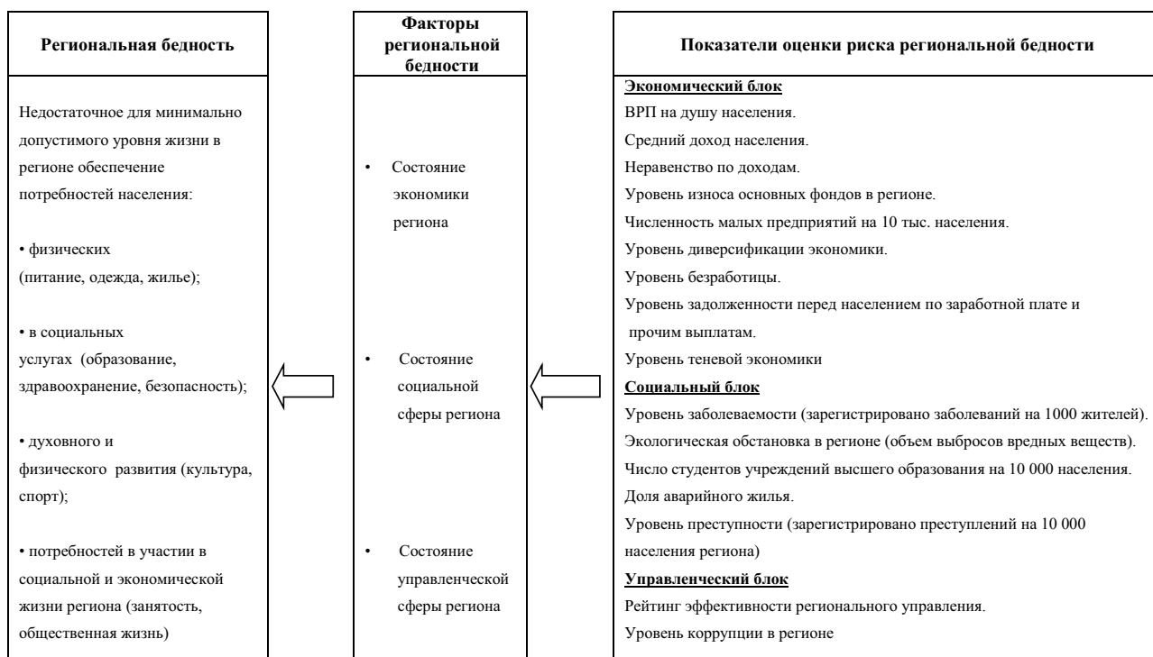
Рис. 2. Комплекс показателей, применяемых для оценки уровня региональной бедности