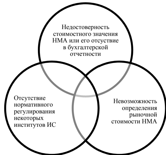
Рис. 1. Блоки проблем, связанных с оценкой нематериальных активов

На текущий момент модель российской бухгалтерской отчетности к новым активам не приспособлена. Положение по бухгалтерскому учету (ПБУ) 14/2007 «Нематериальные активы» 2 попыталось создать приемлемый механизм отражения стоимости нематериальных активов, встроенный в рамки действующих принципов бухгалтерского учета. Основная новация этого документа заключалась