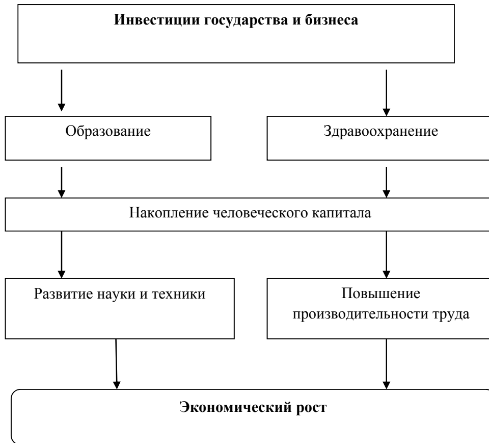
Рис. 1. Зависимость экономического роста от инвестиций государства и бизнеса в науку, здравоохранение и образование

благо, обладающее определенной полезностью. Взгляды на сферу образования поменялись в конце 50-х гг. XX в., после того, как американский экономист Т. Шульц, лауреат Нобелевской премии, обосновал тезис о том, что образование влияет на сферу производства и имеет важное значение для экономики, т.е. оно является формой капитала [3].