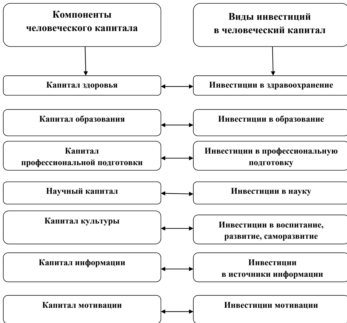
Рис. 3. Взаимосвязь компонентов человеческого капитала с инвестициями

в которой он трудится, наряду с экономическим ростом в государстве и широким применением достижений научно-технического прогресса. «В наше время преимущества в конкурентной борьбе уже не определяются ни размерами страны, ни богатыми природными ресурсами, ни мощью финансового капитала. Теперь все решает уровень образования и объем накопленных обществом знаний» [7]. Образование, информация, опыт становятся главными источниками развития. «Информация и знания в постиндустриальном обществе приобретают исключительно важную роль в производственном процессе, понимаемые... как непосредственная производительная сила» [8].