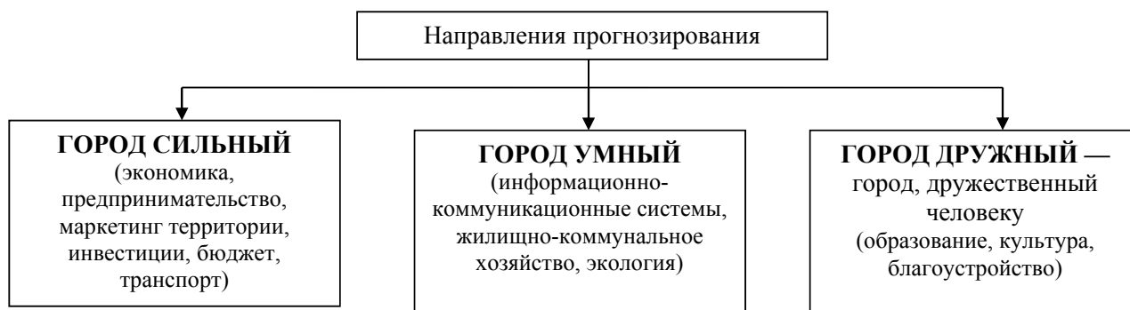
Рис. 2. Направления прогнозирования развития города Липецка

Далее эксперты оценивали ключевые рынки (заказчиков) и составляли таблицу их существующих и будущих потребностей — генерировали будущие проекты. Полученные модели развития проектов были протестированы на достоверность с помощью метода геймсторминга. Проводилась работа с нормативными актами и ожидаемыми законодательными изменениями, а полученные экспертными группами карты были сведены в общую карту времени. Завершающим этапом стала итоговая презентация.