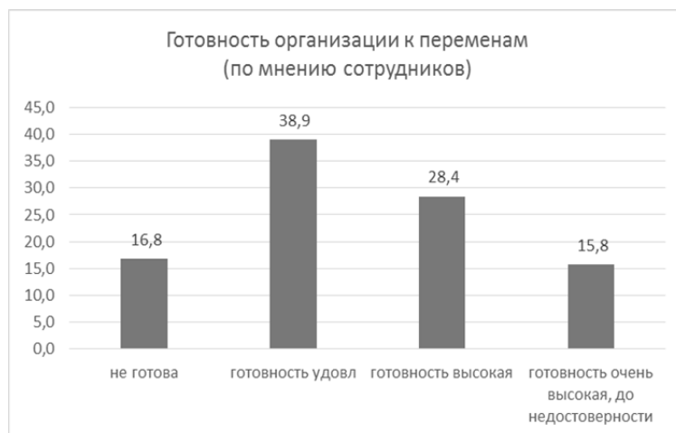
Рис. 1. Готовность организации к изменениям

вых показателей эффективности (KPI); изменение системы мотивации и стимулирования персонала, внедрение различных мотивационных программ; разработка и внедрение программ обучения и развития персонала; изменение работы с кадровым резервом; разработка и реализация широкомасштабных программ по формированию корпоративной культуры и пр.