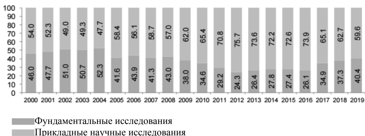
Рис. 4. Ассигнования на гражданскую науку из средств федерального бюджета: распределение на фундаментальные и прикладные научные исследования, %