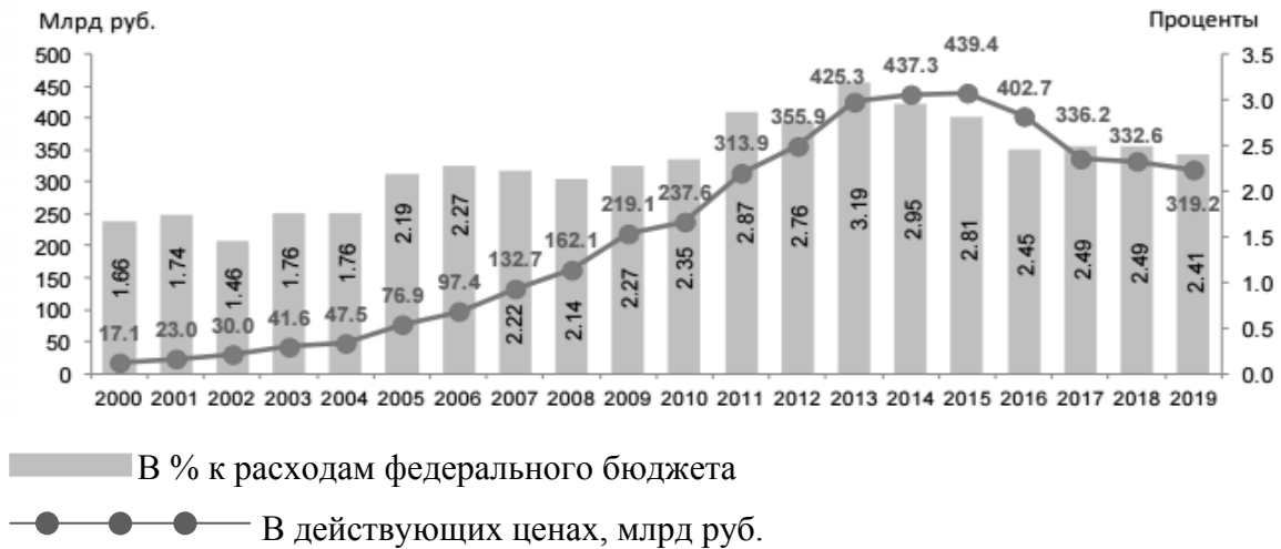
Рис. 3. Ассигнования на гражданскую науку из средств федерального бюджета