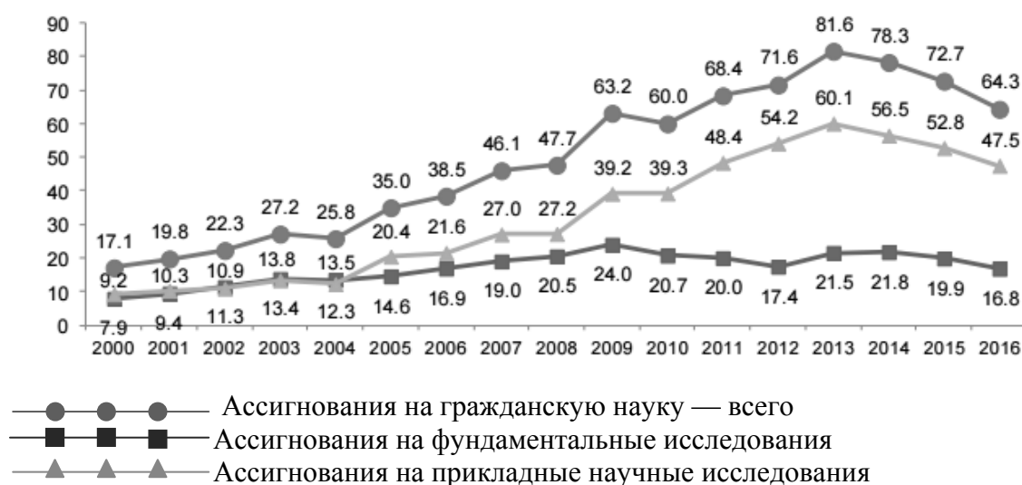
Рис. 5. Ассигнования на гражданскую науку из средств федерального бюджета (млрд руб., в постоянных ценах 2000 г.)

Источник: Ассигнования на гражданскую науку из средств федерального бюджета. URL: https://issek.hse.ru/data/2017/06/28/1171161287/NTI_N_57_28062017.pdf .