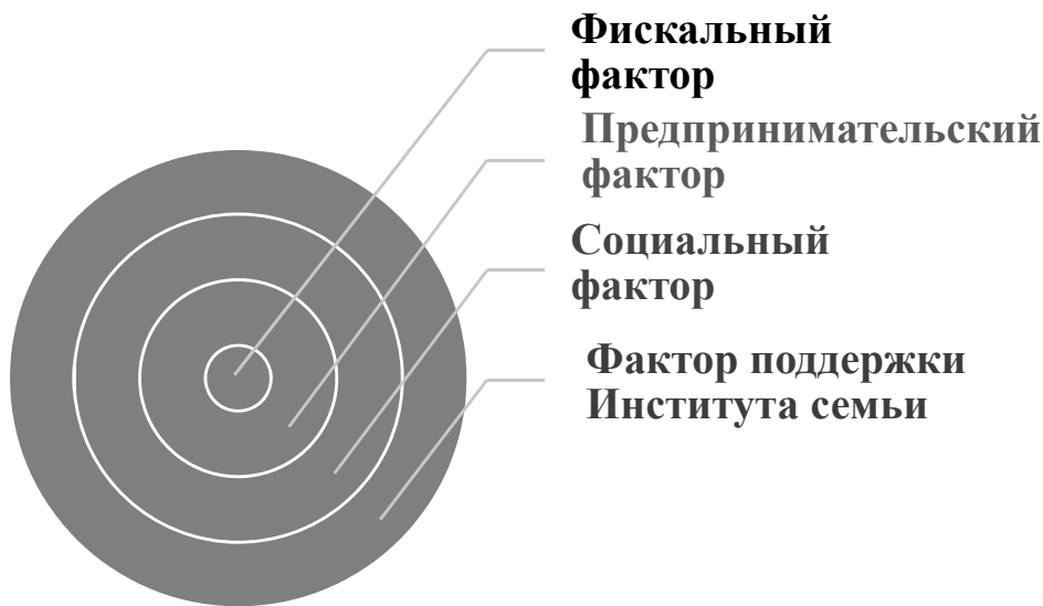
Рис. 6. Приоритетные факторы налогообложения доходов населения в условиях социально ориентированной экономики

К основным рискам перехода к прогрессивному налогообложению физических лиц Л. Н. Лыкова отнесла рост вероятности использования различных моделей налогового арбитража для снижения итоговой суммы налога; повышение вероятности использования различных моделей налогового планирования для снижения итоговой суммы налога. Кроме того, уменьшение уровня налогообложения низкодоходных категорий населения фактически лишит целый ряд субъектов Российской Федерации существенной части собственных доходов. При введении прогрессивного подоходного налога (если не будет пересмотрен порядок зачисления налога в доход бюджетов субъектов Российской Федерации) в выигрыше окажутся субъекты Российской Федерации с наиболее состоятельным населением.