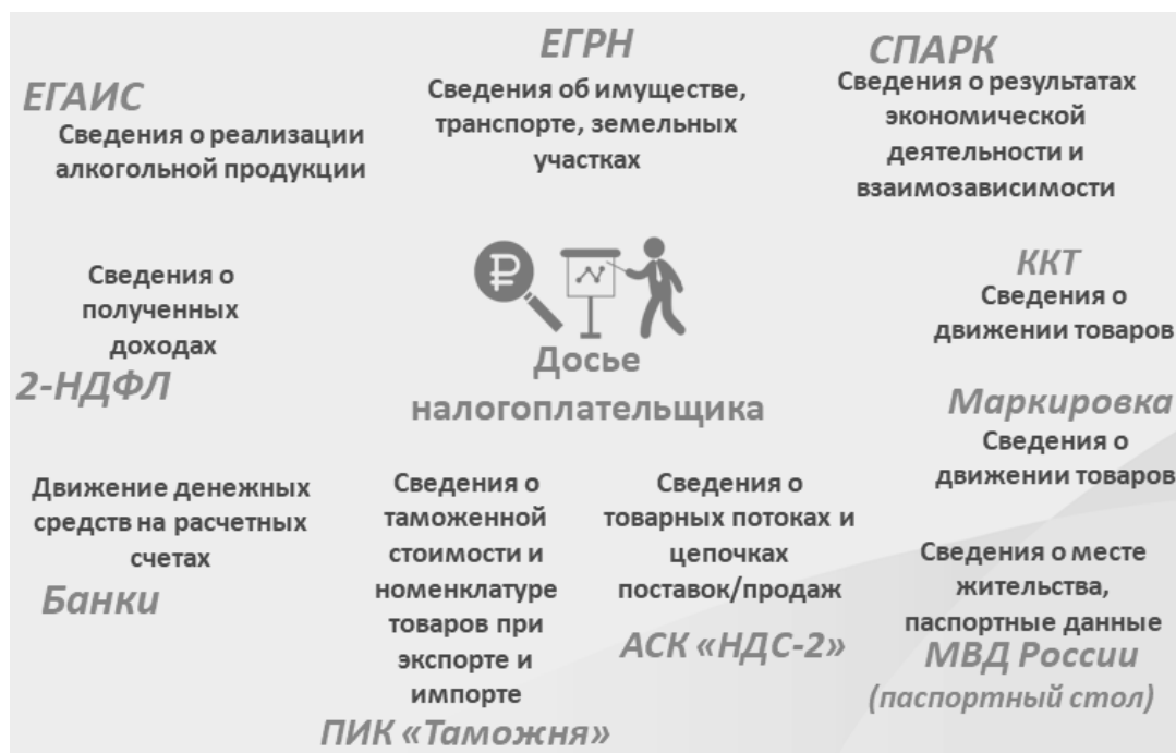
Рис. 2. Развитие информационного пространства налоговых органов

Использование передовых инструментов риск-ориентированного налогового контроля позволяет существенно снижать административную нагрузку на бизнес, что может рассматриваться как косвенный показатель снижения налоговой нагрузки в целом (рис. 3).