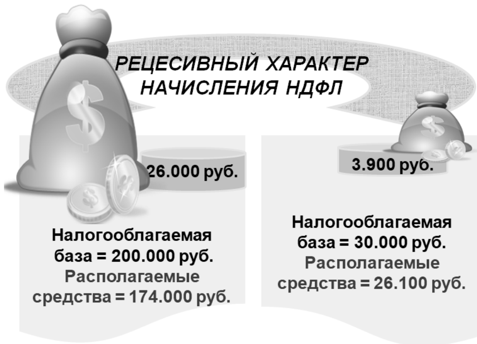
Рис. 7. Приоритетные факторы налогообложения доходов населения в условиях социально ориентированной экономики