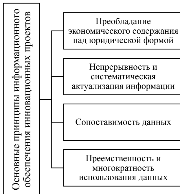
Рис. 1 / Fig. 1. Основные принципы информационного обеспечения инновационно-инвестиционной деятельности в экономических субъектах / Basic principles of information support of innovative and investment activities in economic entities

Сущность стейкхолдерского подхода базируется на том, что устойчивый успех бизнеса может быть достигнут только при соблюдении интересов и требований заинтересованных сторон, способных оказать воздействие на деятельность экономического субъекта. Данная теория предполагает, что фирмы могут становиться более прибыльными и успешными в долгосрочной перспективе за счет устойчивых отношений, выстроенных в результате взаимодействия с заинтересованными сторонами, путем налаживания с ними диалога и учета их требований при принятии управленческих решений. В этой связи современные успешные компании должны не только приносить прибыль, но и обеспечивать уровень благосостояния сотрудников, защиту окружающей среды, поступления налогов в бюджет и социальную сферу, наполнять рынки благ товарами и услугами, востребованными обществом и т.д.