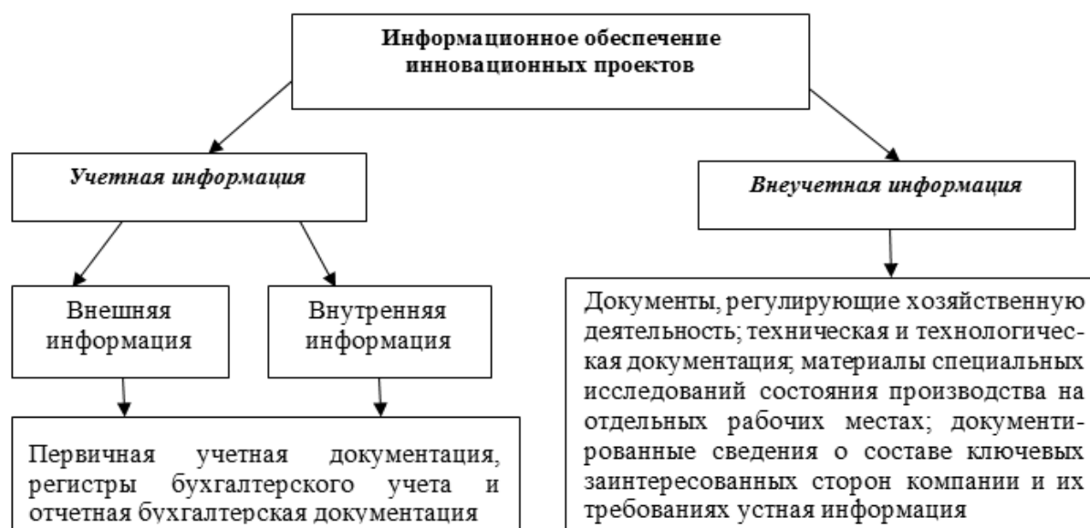
Рис. 2 / Fig. 2. Информационное обеспечение управления инновационно-инвестиционными проектами / Information support for the management of innovation and investment projects