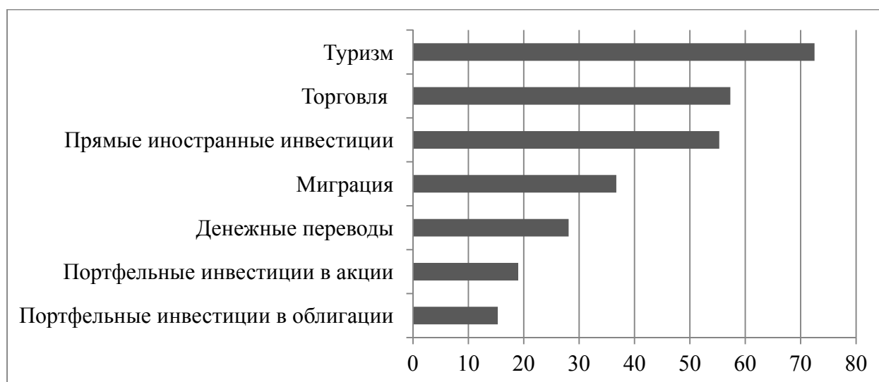
Рис. 2 / Fig. 2. Показатели региональной интеграции в Азии, в% от общего объема (данные по 48 странам – членам Азиатского банка развития), 2016 г. / Indicators of regional integration in Asia, in% of total volume (statistics on 48 member countries of the Asian Development Bank), 2016