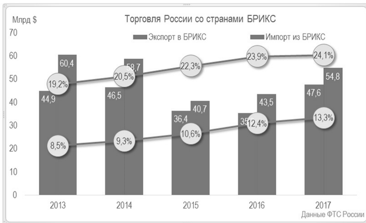
Рис. 1. Динамика торгово-экономических отношений со странами БРИКС