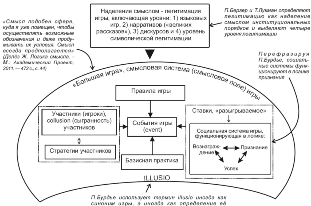
Рис. 2 / Fig. 2. Контуры института как игры / Contours of the Institution as a game

центры, уполномоченные ведомства) и заинтересованных [стейкхолдеры, финансовые организации и консультанты, средства массовой информации (СМИ), некоммерческие организации (НКО) и др.].