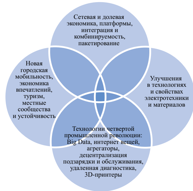
Рис. 1. Области формирования конкурентных преимуществ бизнес-модели проката электросамочкатов

Суть нового витка технологий в развитии транспорта в рамках четвертой промышленной революции состоит прежде всего в том, что за последние 10–15 лет в систему «умного» города были интегрированы многие технологии, отражающие характер индустрии 4.0: Electronic Toll Collection (ETC), Highway Data Collection (HDC), Traffic Management Systems (TMS), Vehicle Data Collection (VDC), Transit Signal Priority (TSP), Emergency Vehicle Preemption (EVP). В рамках встраивания мультимодальных систем к ним добавились улучшенная интеграция данных и приложений в смартфонах [Barreto, Amaral, Pereira, 2017]. Наряду с этим более качественные сенсоры и датчики коммуникации и технологии в секторе Интернета вещей обеспечат дальнейшее развитие Интернета вещей в транспортных системах [Gilchrist, 2016]. По состоянию на середину 2019 г. во всех четырех областях конкурентных преимуществ бизнес-модели электросамочкатов хорошо просматриваются достижения, которые могут быть получены в краткосрочной и среднесрочной перспективе (рис. 1).