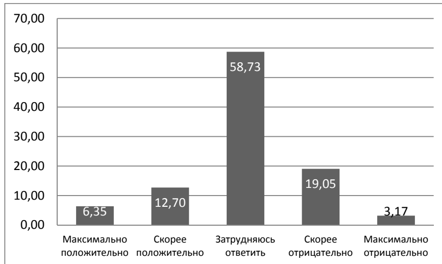
Рис. 2. Оценка текущей ситуации в налоговой системе РФ

знает, что НДФЛ с вкладов в банках в 2018 г. платят с дохода свыше 13,25%. Примечательно, что ровно столько же потенциальных интернет-предпринимателей считает, что проценты по банковским вкладам платить не нужно. Треть опрошенных (33,33%) знают, что при выигрыше в лотерею 13% необходимо заплатить государству. Число студентов, информированных о том, что уплачивать налог необходимо лишь с суммы выигрыша в диапазоне от 4000 до 15 000 руб., составляет 22%. Про обязательства по уплате налогов при открытии ИП на общей системе налогообложения знают лишь 7% потенциальных предпринимателей. Согласно НК РФ предприниматель, работающий на ОСНО, обязан уплачивать НДФЛ и НДС. Студентам была представлена возможность сделать множественный выбор, и лишь 4 человека из 63 верно ответили на вопрос.