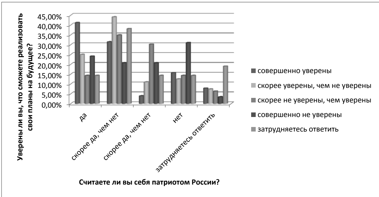
Рис. 2. Сопряженность «патриотизм – уверенность в реализации своих планов и стремлений»

нов и стремлений» показал, что среди тех, кто «совершенно уверен в реализации своих планов и стремлений», 41,2% респондентов считают себя патриотами, еще 31,4% — «скорее патриотами, чем нет», и только 15,7% не отождествляют себя с патриотами. И, наоборот, среди тех, кто «совершенно не уверен в реализации своих планов и стремлений», 31% не считают себя патриотами, 20,7% «скорее не отождествляют себя с патриотами» (рис. 2).