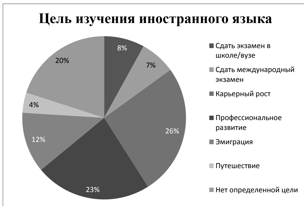
Рис. 1. Цель изучения иностранного языка