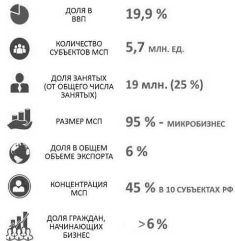
Рис. 1. Основные показатели развития малого и среднего бизнеса в 2016–2017 гг.

Анализ научной литературы показал, что авторы высоко оценивают значение малого предпринимательства в современной российской экономике. Так, последние 2 года (2016–2017) имели место положительные тенденции в сфере развития малого и среднего предпринимательства: так, Минэкономразвития отметило рост таких показателей, как объем оборота малых и средних предприятий (37%; при этом свыше 80% от общего оборота пришлось на микро- и малые