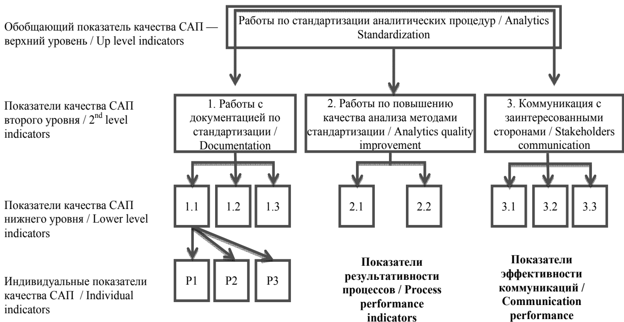
Рис. 4 / Fig. 4. Система показателей оценки качества системы стандартизации аналитических процедур / System of indicators to assess the quality of the analytical procedures standardization system