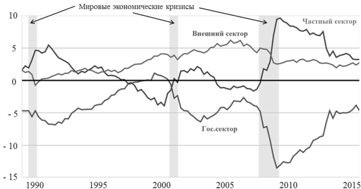
Рис. 2 / Fig. 2. Финансовые балансы основных институциональных секторов экономики США (государственного, частного и внешнего секторов), квартальные данные 1990–2015 гг., % ВВП / Financial balances of the main institutional sectors of the US economy (public, private and external sectors), quarterly data 1990–2015, % GDP