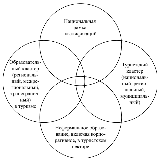
Рис. 1. Соотношение предметных областей

ческие, образовательные, деловые и административные органы осознали и стали прорабатывать с начала 2000-х годов.