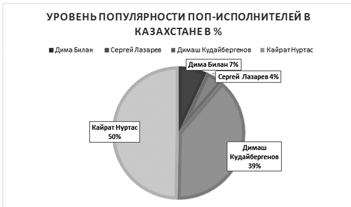
Рис. 3 / Fig. 3. Анализ трендов: сравнение популярности российских и казахстанских исполнителей в Казахстане на основе данных о поисковых запросах в Google за последние 12 месяцев / Trend analysis: comparing the popularity of Russian and Kazakh artists in Kazakhstan based on Google search query data for the past 12 months