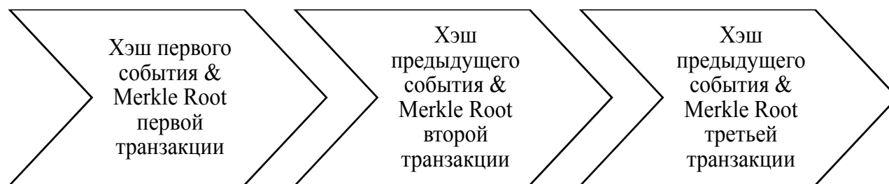
Рис. 1 / Fig.1. Сводный вид блокчейна / Blockchain summary view