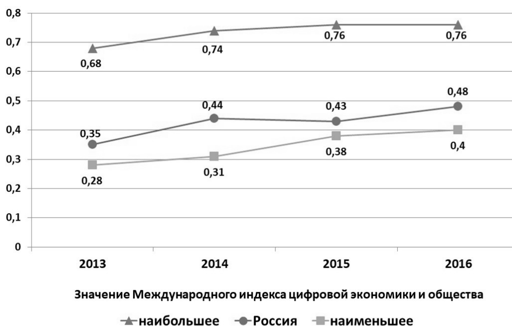
Рис. 1 / Fig. 1. Международный индекс цифровой экономики и общества / International index of digital economy and society