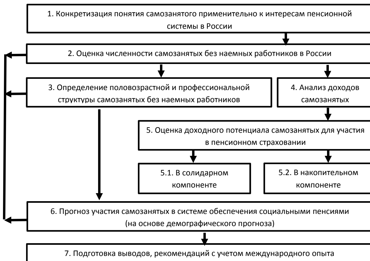
Рис. 1 / Fig. 1. Общий алгоритм исследования / General research strategy