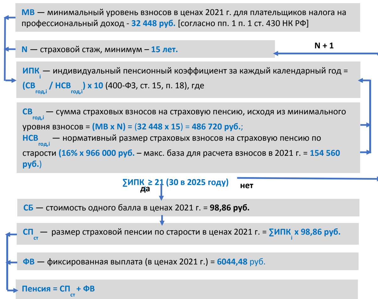
Рис. 4 / Fig. 4. Алгоритм расчета страховой пенсии по старости для самозанятого / Calculating algorithm for the self-employed old-age insurance pension