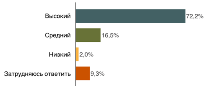
Рис. 2. Социологический опрос граждан о коррупции в России