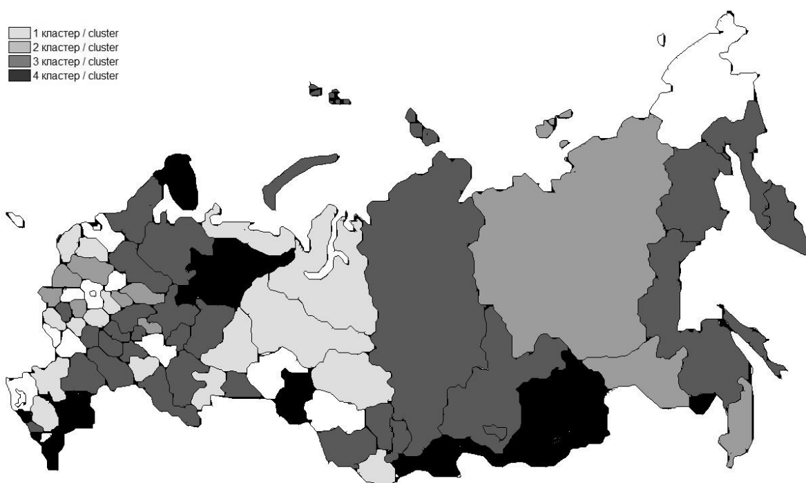
Рис. 2 / Fig. 2. Распределение регионов РФ по уровню миграционной привлекательности по состоянию на 2019 г. / Spreading by regions of the Russian Federation by the level of migration attractiveness as of 2019