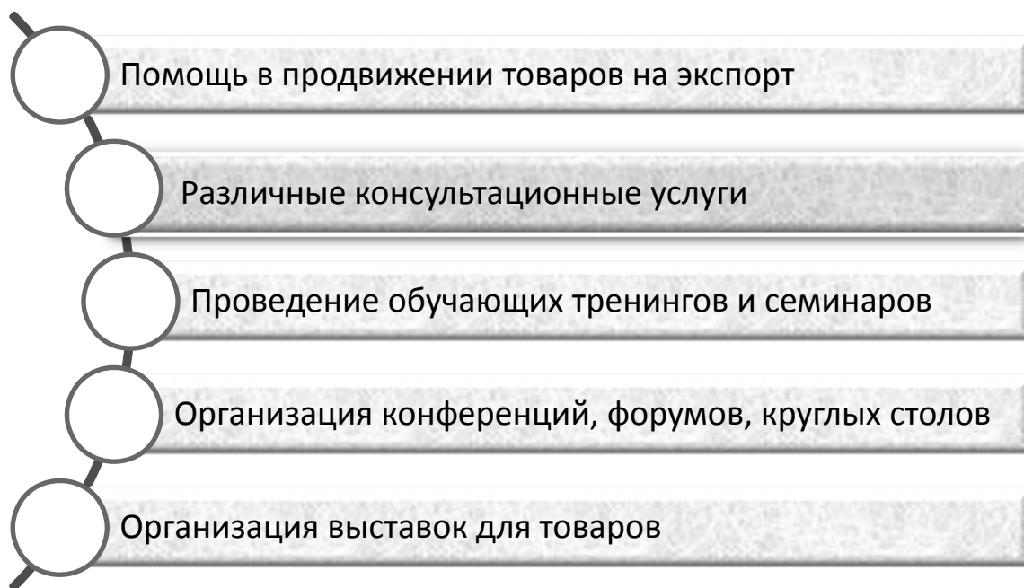
Рис. 3 / Fig. 3. Нефинансовые меры поддержки предпринимательства / Non-financial measures to support entrepreneurship