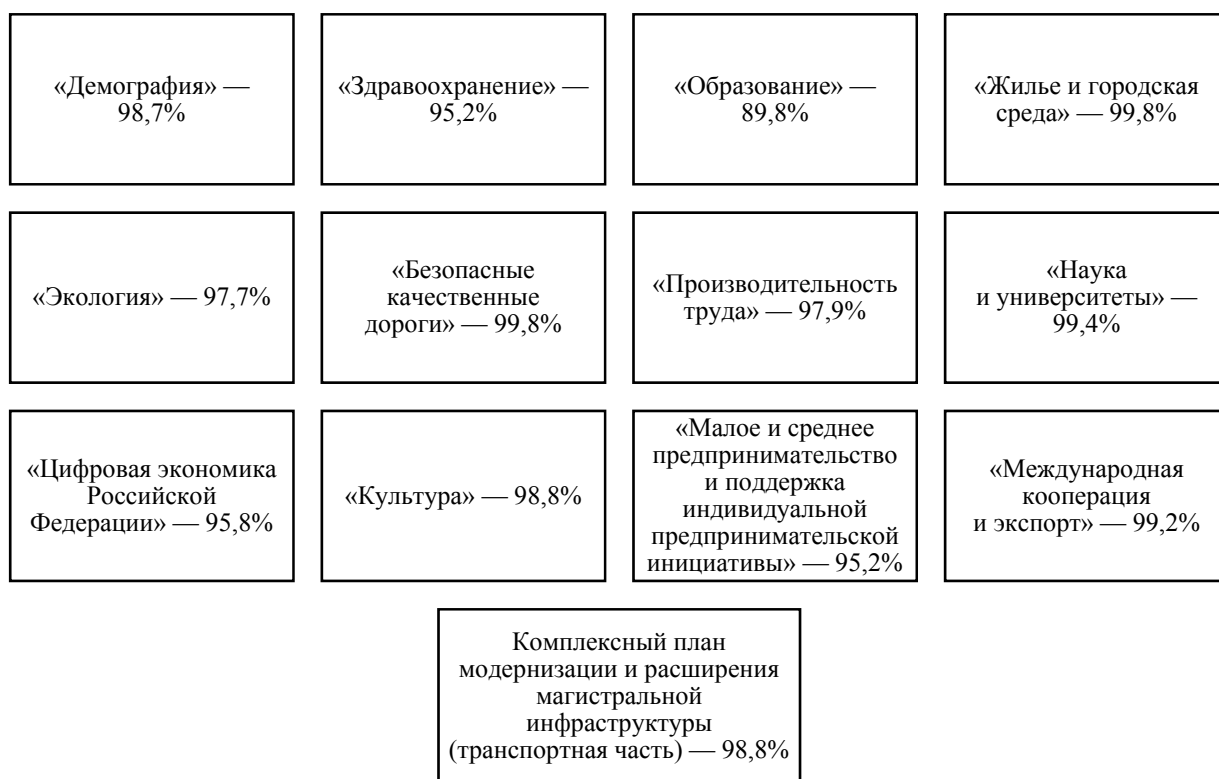
Рис. 2. Исполнение расходов в разрезе национальных проектов РФ

Источник: составлено автором на основании данных «Исполнение расходов федерального бюджета на реализацию национальных проектов». Минфин России. Официальный сайт Министерства. URL: https://minfin.gov.ru/ru/press-center/?id_4=37752-ispolnenie_raskhodov_federalnogo_byudzheta_na_ryealizatsiyu_natsionalnykh_proektov