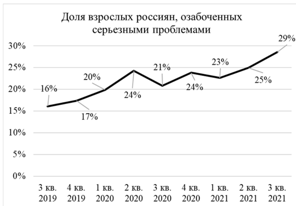
Рис. 1 / Fig. 1. Проблемный фон в России в 2019–2021 гг.