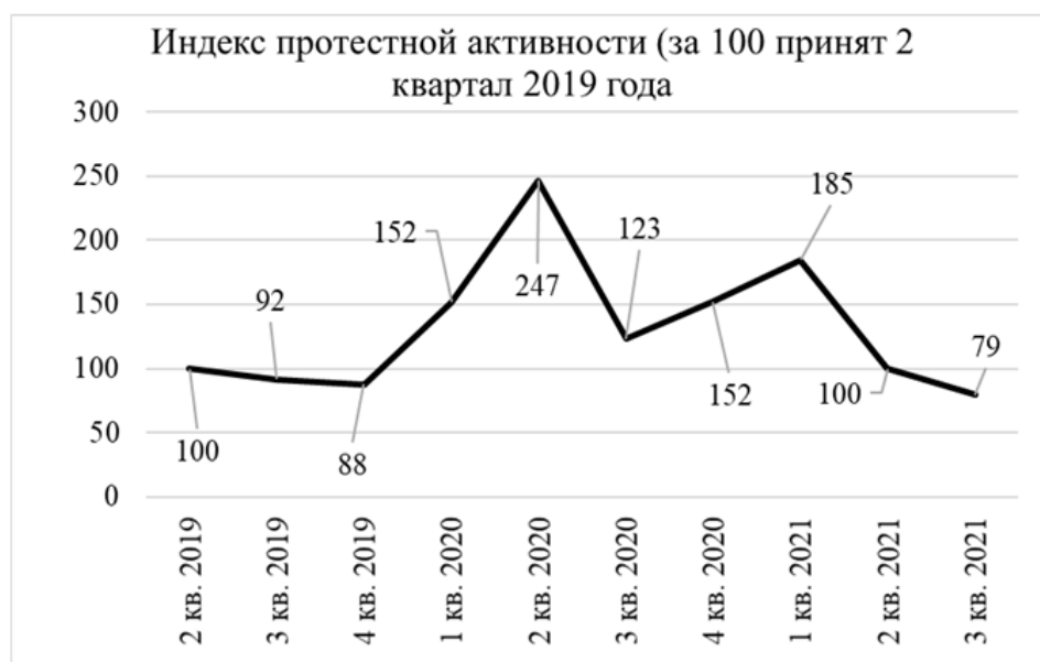
Рис. 2 / Fig. 2. Индекс протестной активности в 2019–2021 гг. / Protest activity index in 2019–2021