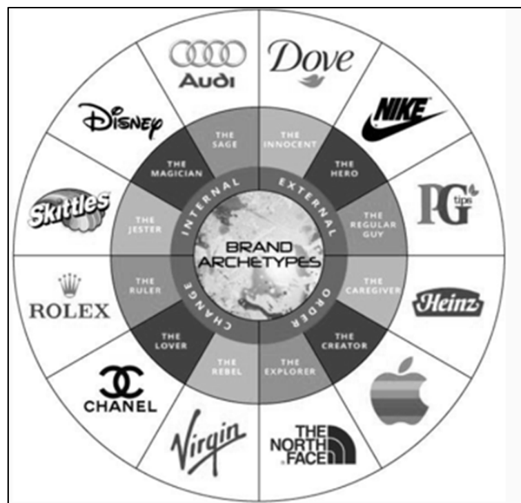
Рис. 2 / Fig. 2. Применение архетипов на примере крупных брендов / The use of archetypes on the example of big brand names