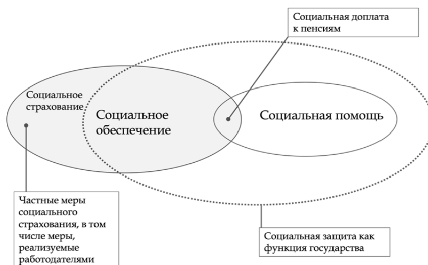
Рис. 1 / Fig. 1. Состав государственной политики в сфере социальной защиты / Components of state policy in the field of social protection