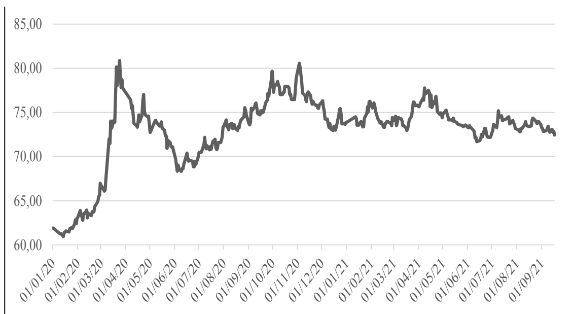
Рис. 1 / Fig. 1. Динамика курса доллара США к российскому рублю в период с 1 января 2020 г. по 1 сентября 2021 г. / Dynamics of the US dollar against the Russian ruble in the period from January 1, 2020 to September 1, 2021