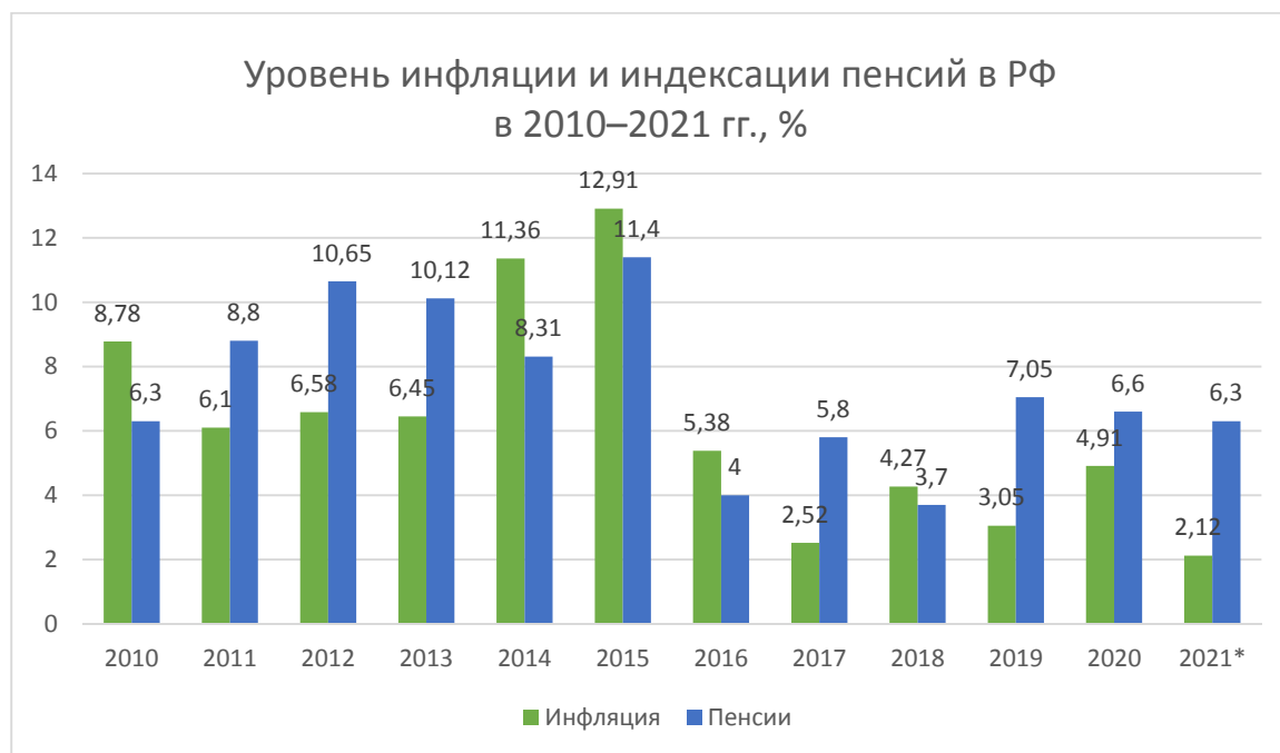
Рис. 3 / Fig. 3. Уровень инфляции и индексации пенсий в РФ в 2010–2021 гг., % / Inflation rate and pension indexation in the Russian Federation in 2010–2021, %