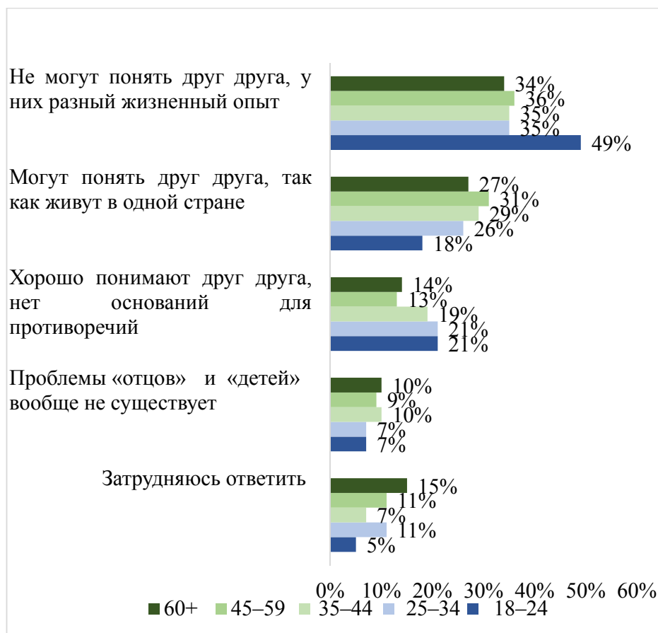
Рис. 1 / Fig. 1. Распределение ответов респондентов на вопрос: как вы считаете, какое из следующих высказываний наиболее точно описывает нынешние отношения «отцов» и «детей»? / Assignment of respondents' replies to the question: Which of the following statements do most precisely depict the current link between fathers and children?