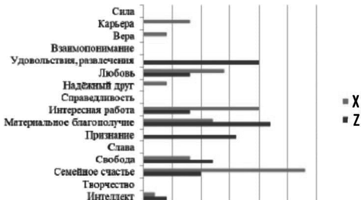
Рис. 2 / Fig. 2. Распределение ответов респондентов на вопрос: какие ценности имеют для вас наибольшее значение? / Assignment of respondents' replies to the question: What values are the most important to you?