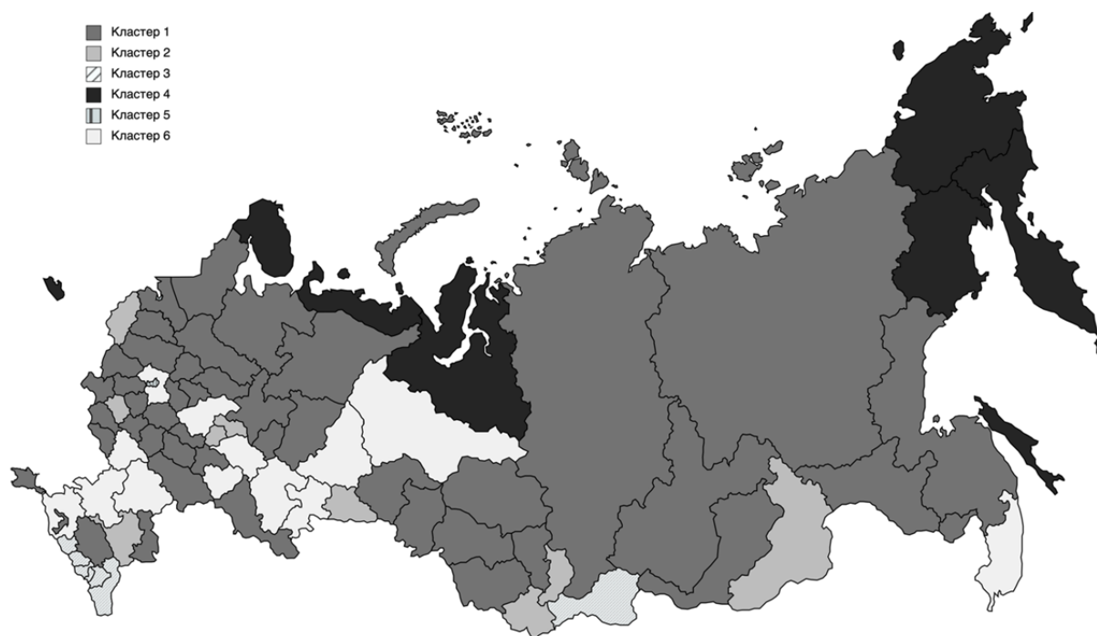
Рис. 1 / Fig. 1. Кластеризация субъектов РФ по типу социального недовольства, % / Clustering of the Russian Federation regions by type of social discontent, %