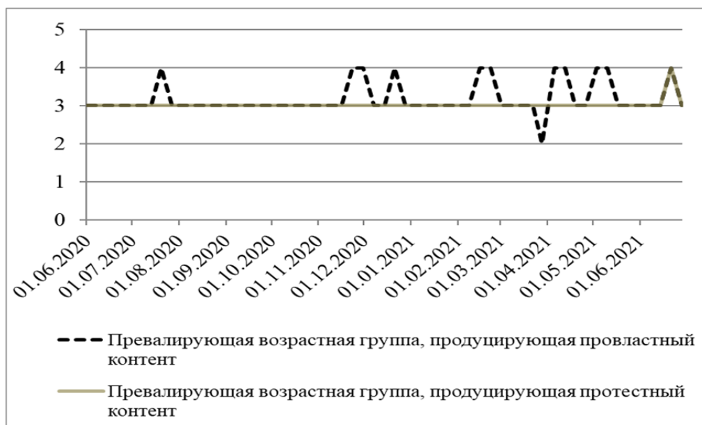
Рис. 1 / Fig. 1. Возрастные характеристики продуцентов релевантного цифротока / Age characteristics of the generators of the relevant digital stream