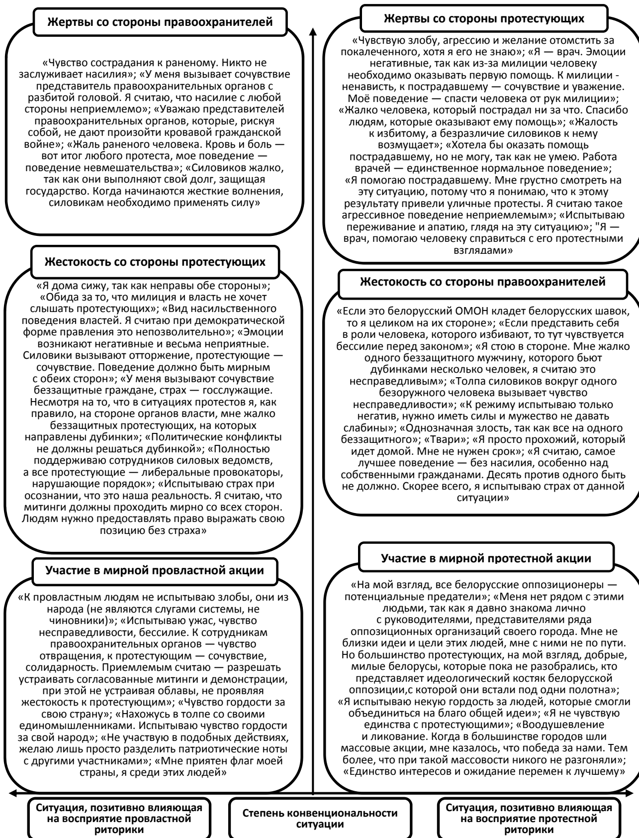
Рис. 5 / Fig. 5. Смысловая карта ответов респондентов / Semantic map of respondents' answers