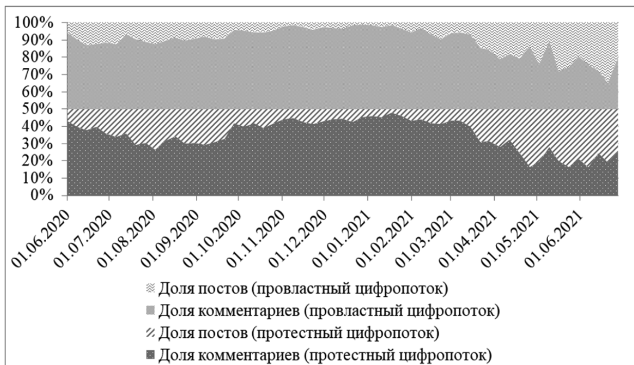
Рис. 3 / Fig. 3. Долевое соотношение типов релевантного цифрпоттока / Share ratio of relevant digital stream types