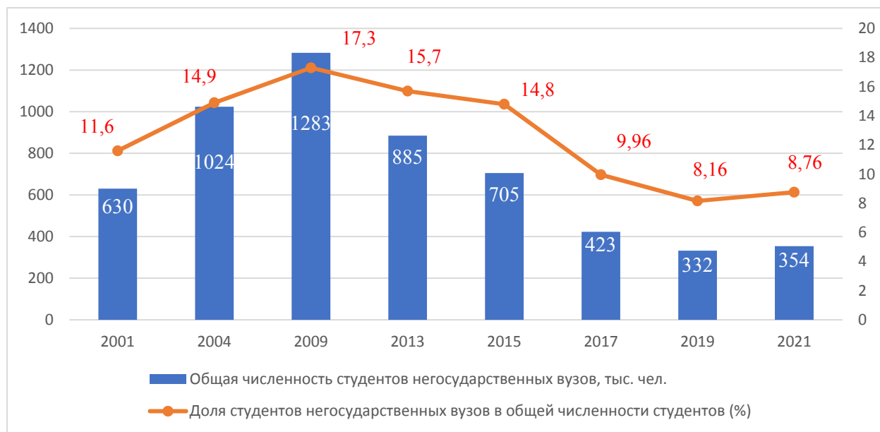
Рис. 3. Изменение численности студентов частных образовательных организаций, реализующих программы высшего образования