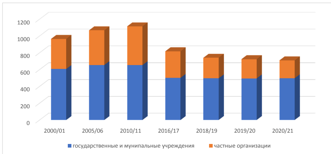
Рис. 1. Динамика образовательных организаций, реализующих программы высшего образования [4, 6]