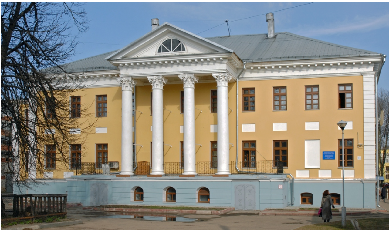
Рис. 1. Дом Сорокиных на улице Кооперативной (бывшей улице Железной) в историческом центре Ярославля [3]

окнами. Здание стало выглядеть очень красиво и представительно, это можно увидеть на рис. 1 .