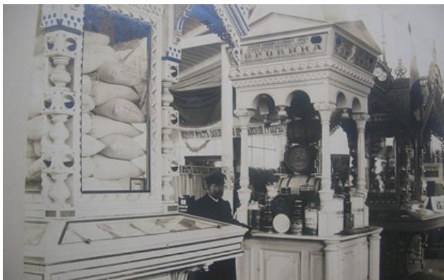
Рис. 2. Торговый павильон купцов Сорокиных

Источник: Марасанова В.М. Пять поколений купцов Сорокиных в Ярославле. Городские новости: интернет-портал. URL: https://city-news.ru/news/history/pyat-rokoleniy-kuptsov-sorokinykh-v-yaroslavle/ (дата обращения: 15.12.2021).