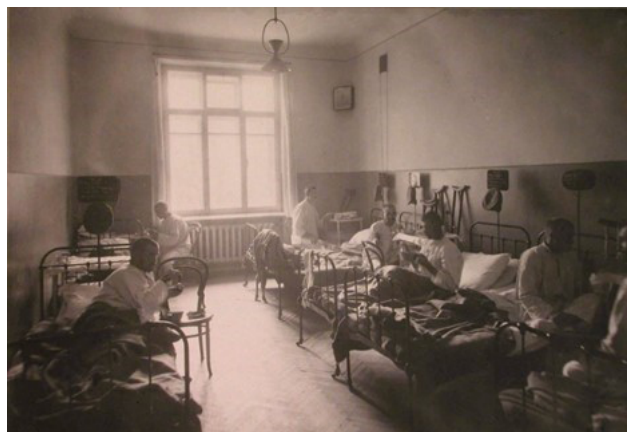
Рис. 3. Больница, созданная купцами Сорокиными

По причине повышенной опасности для здоровья работников рабочий день составлял 4–5 часов, а что касается остальных предприятий, то их продолжительность рабочего дня достигала 12–13 часов. Согласно установленно-