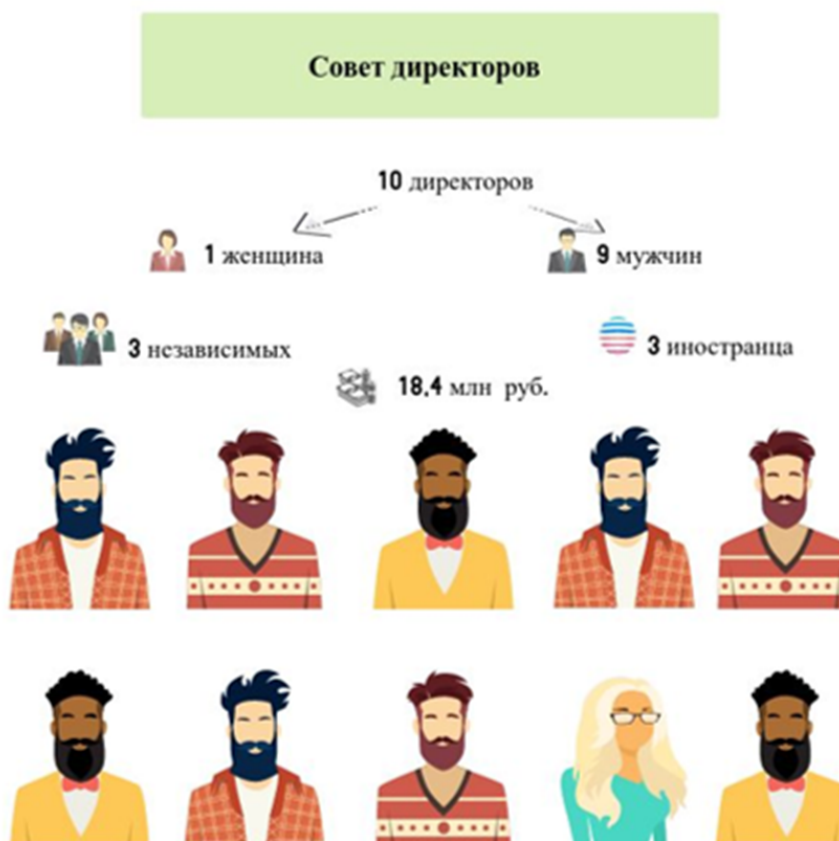
Рис. 1 / Fig. 1. Среднестатистический состав совета директоров российских компаний / Russian average board of directors