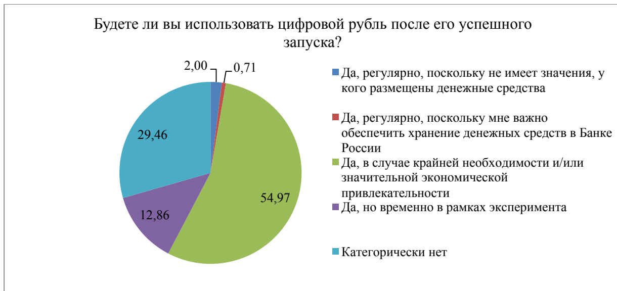
Рис. 3 / Fig. 3. Степень готовности российского общества к принятию цифрового рубля Банка России, % общего числа опрошенных представителей поколений X, Y, Z / The Degree of Readiness of Russian Society to Accept the Digital Ruble of the Bank of Russia, % of the Total Number of Respondents from Generations X, Y, Z