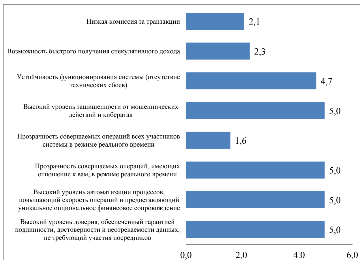
Рис. 1 / Fig. 1. Привлекательность атрибутов доверенной цифровой среды, средний балл / Attractiveness of Trusted Digital Environment Attributes, Average Score