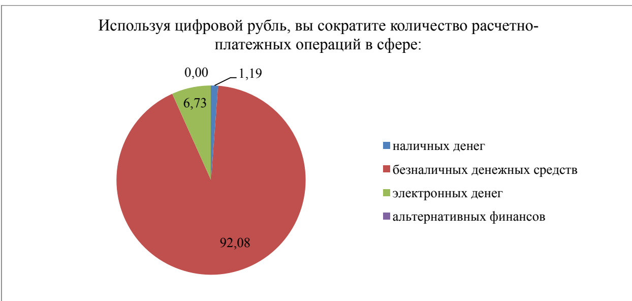
Рис. 4 / Fig. 4. Восприятие респондентами роли цифрового рубля как альтернативного способа осуществления расчетно-платежных операций, % общего числа опрошенных представителей поколений X, Y, Z / Respondents' Perception of the Role of the Digital Ruble as an Alternative Method of Settlement and Payment Transactions, % of the Total Number of Respondents From Generations X, Y, Z