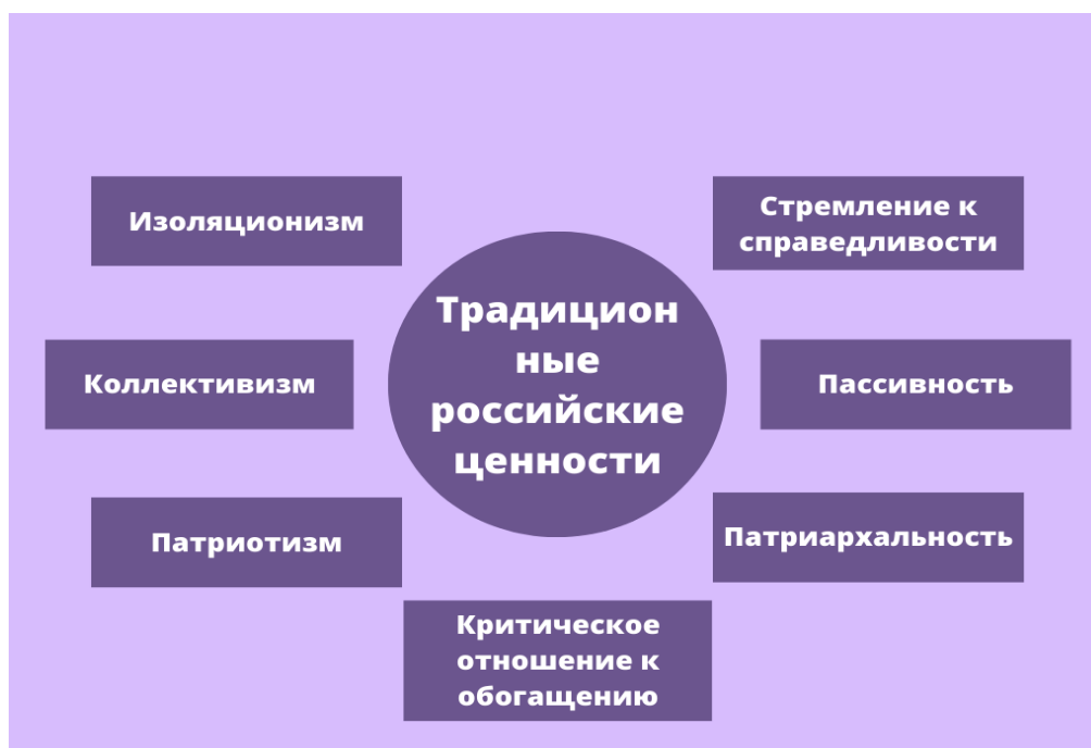
Рис. 1. Традиционные российские ценности