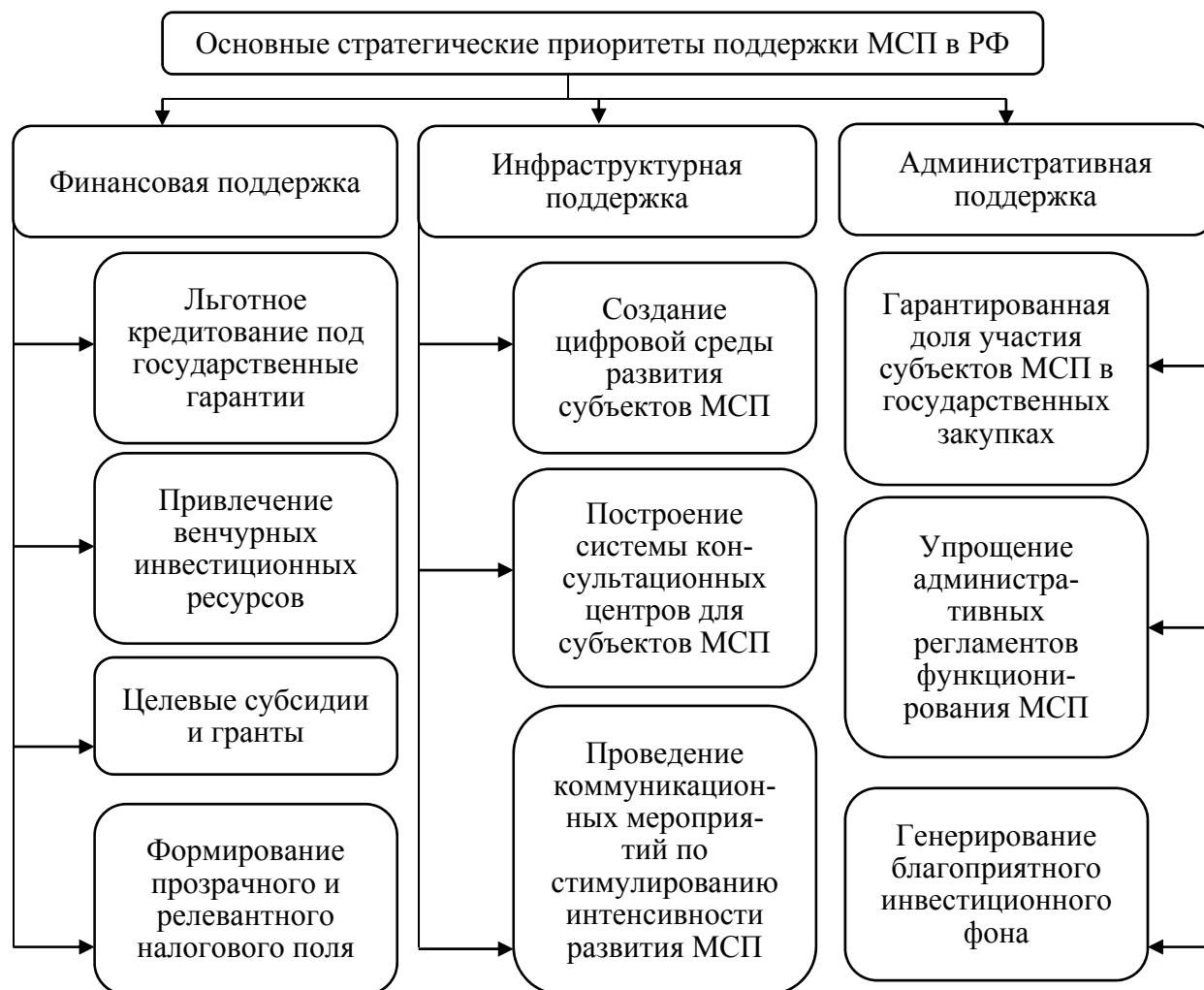
Рис. 1 / Fig. 1. Основные стратегические приоритеты поддержки МСП в РФ / Key strategic priorities for supporting SMEs in the Russian Federation